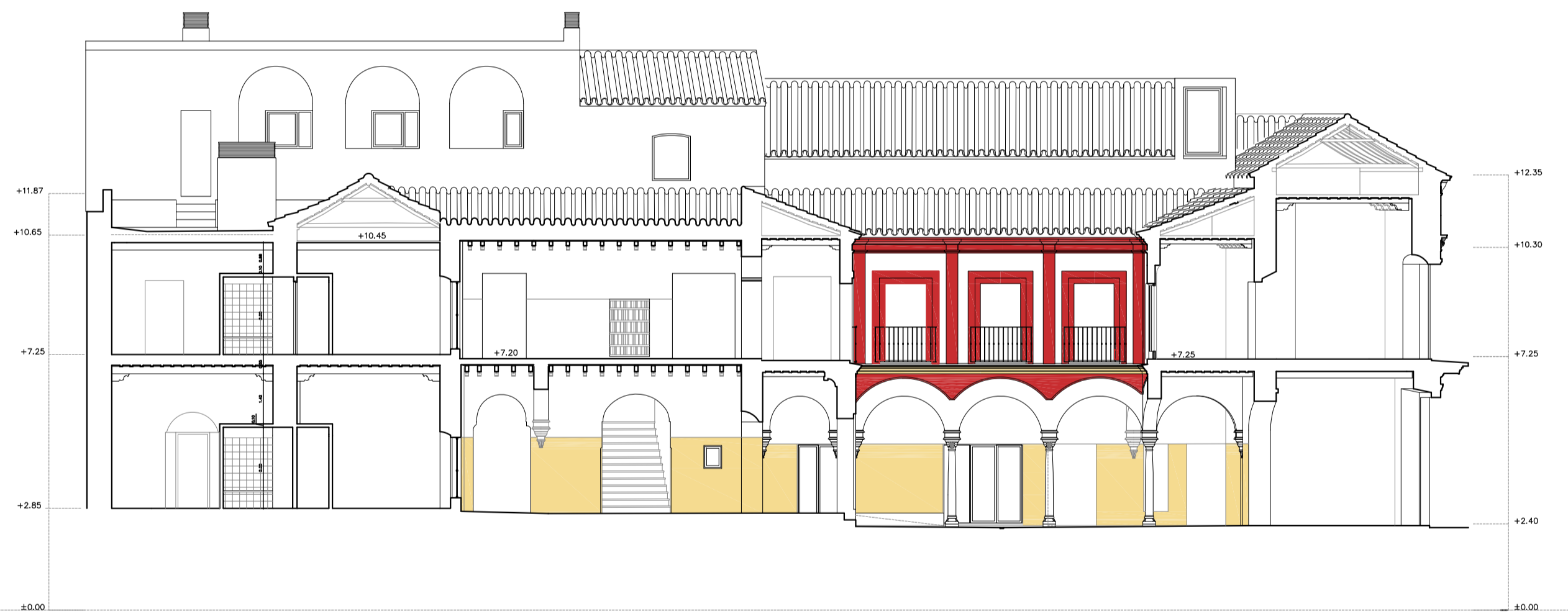
ESTADO REFORMADO_SECCIÓN 3 1/150