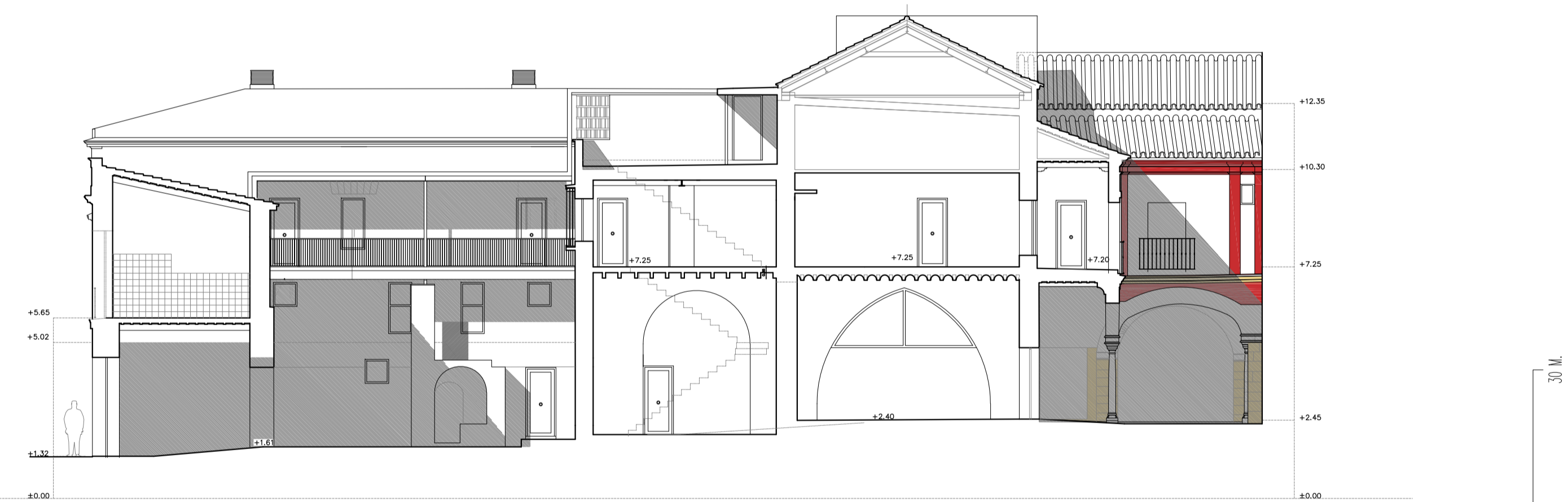
ESTADO REFORMADO_SECCIÓN 4 1/150