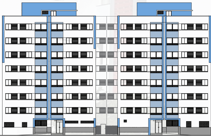
ALZADO PRINCIPAL OESTE