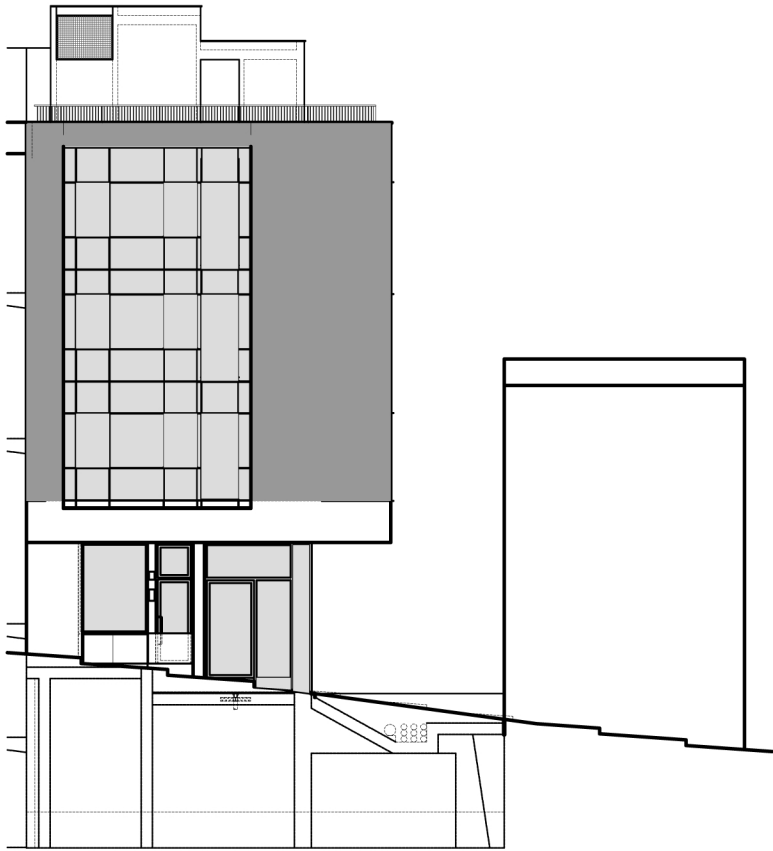
FAÇANA BAIXADA DE LES ESCALETES