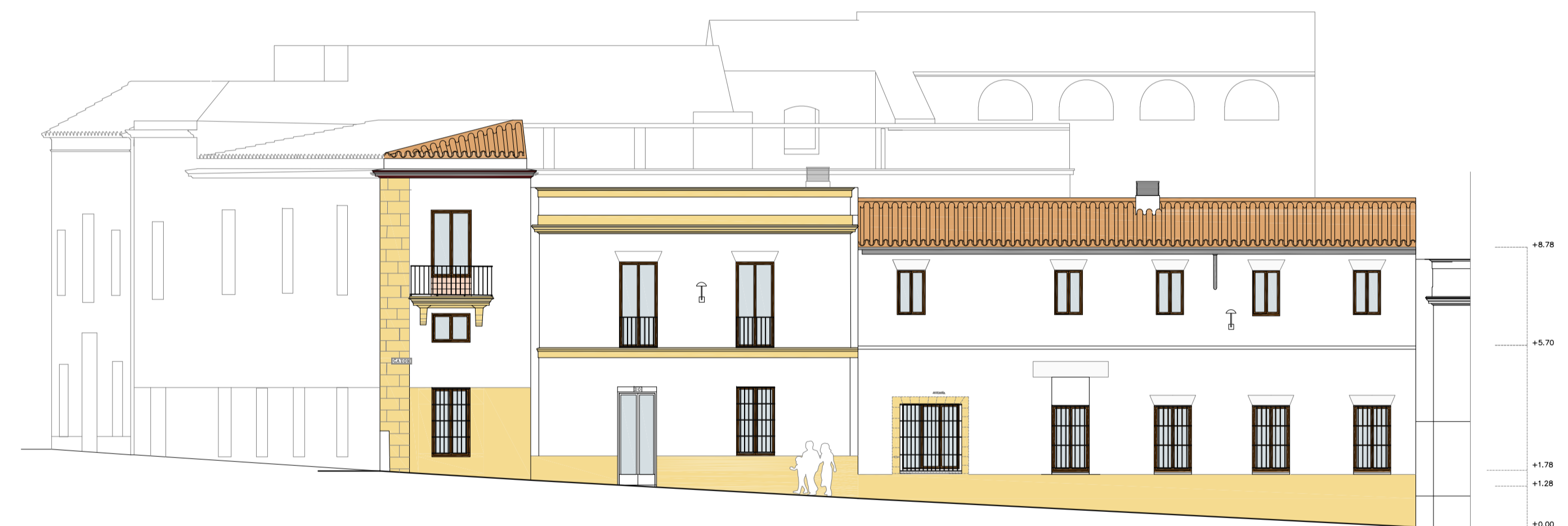
ESTADO REFORMADO_ALZADO C/ CAZ3N (SECCI3N 2) 1/150