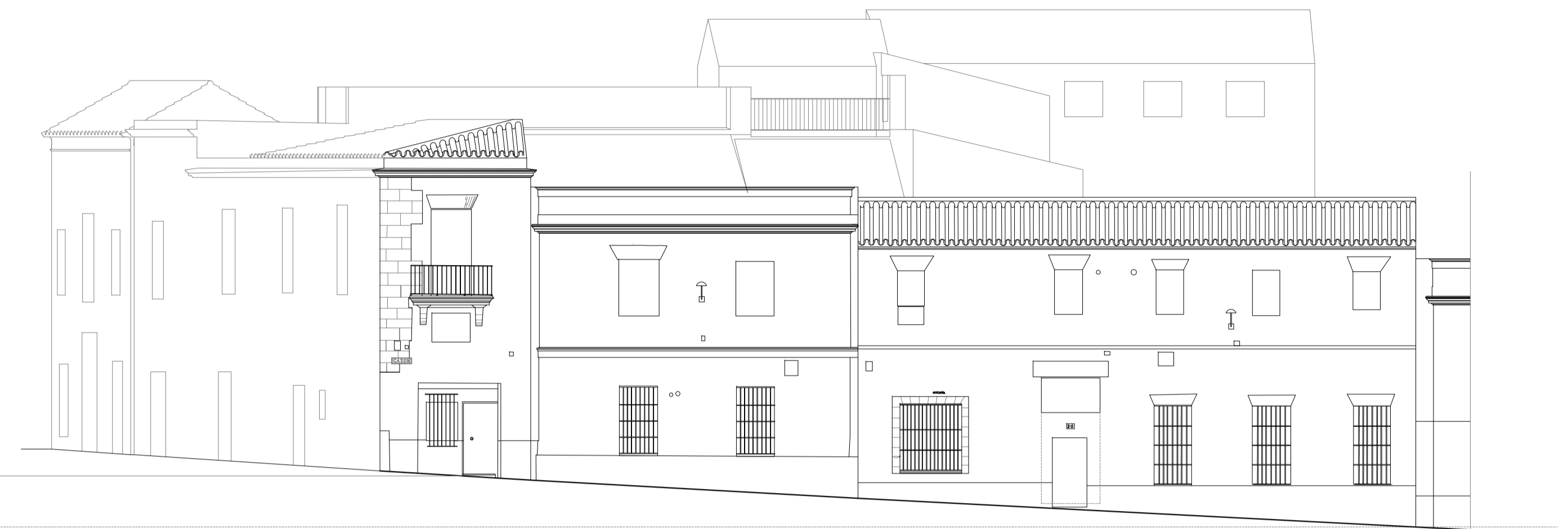
ESTADO PREVIO_ALZADO C/ CAZ3N (SECCI3N 2) 1/150