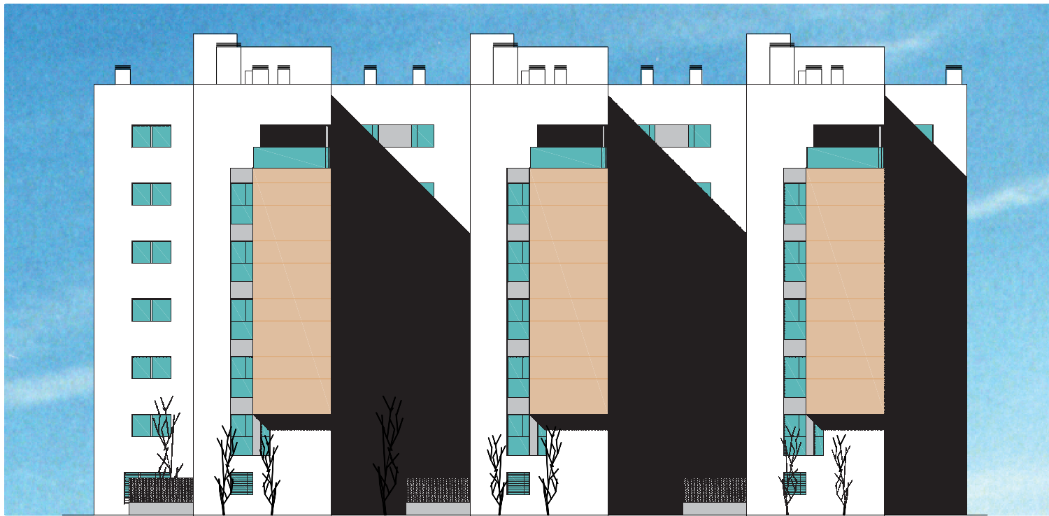
2. ALZADO ESTE