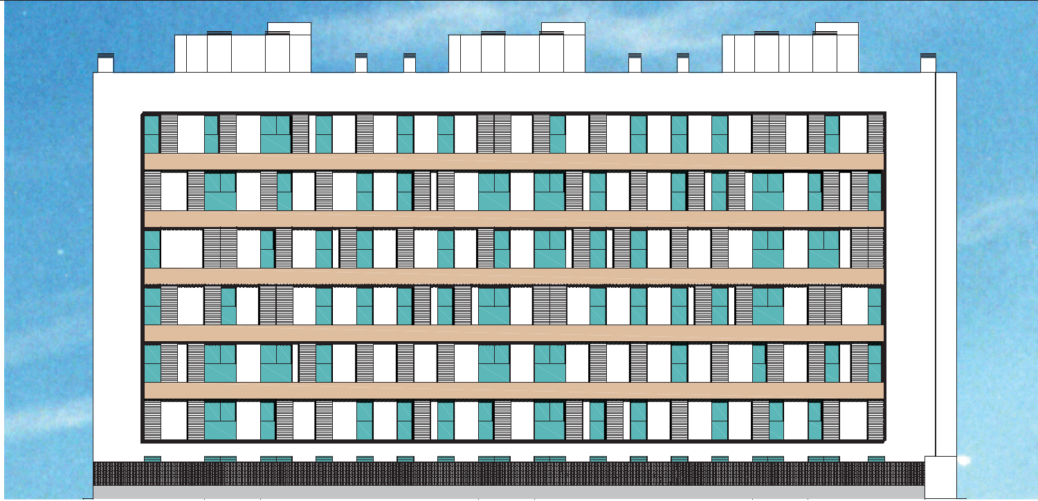
1. ALZADO OESTE