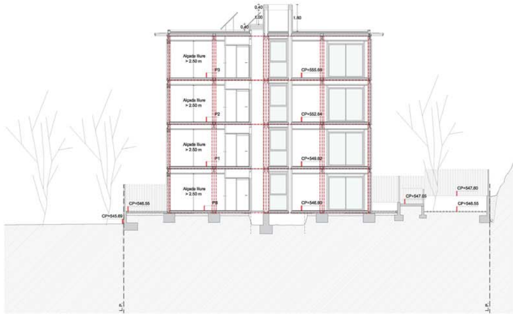
S1 SECCIÓ TRANSVERSAL E: 1/100