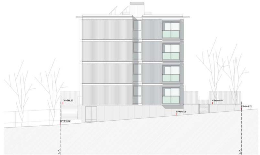
A1 ALÇAT EST E: 1/100