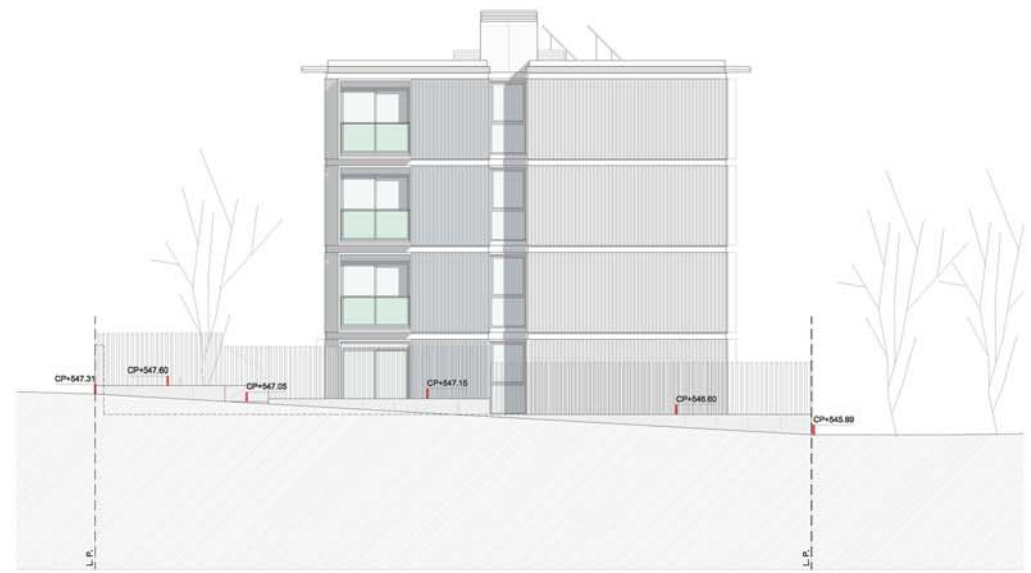
A2 ALÇAT OEST E: 1/100