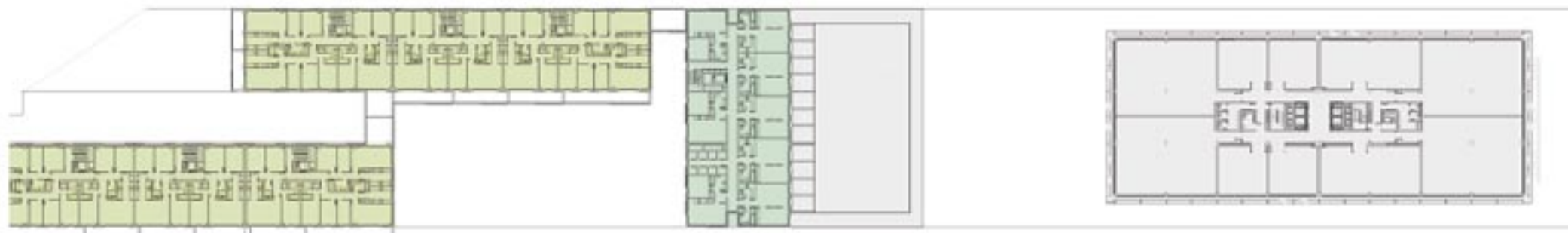
NIVEL·L ESQUEMA D'USOS - PLANTA TIPUS