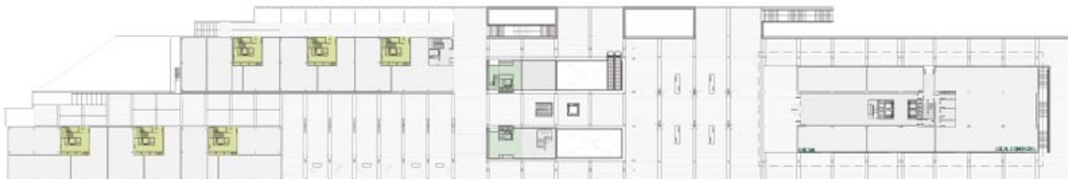
NIVEL·L ESQUEMA D'USOS - PLANTA BÀSICA - NIVELL +1.00