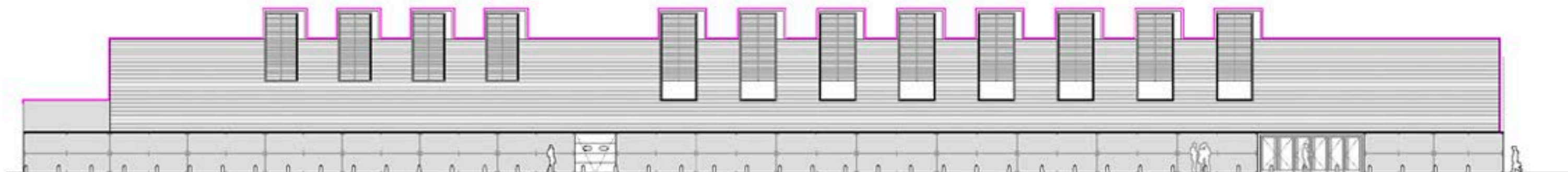
Alzado lado tierra. Por esta fachada se realiza el acceso peatonal al edificio. El zócalo tiene aquí una escala humana, ajustada a la altura de las puertas.