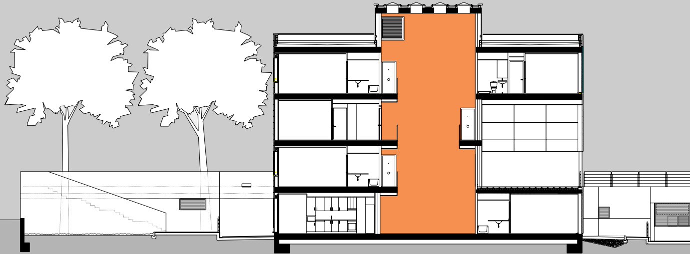
SECCIÓ A-A' 1:250