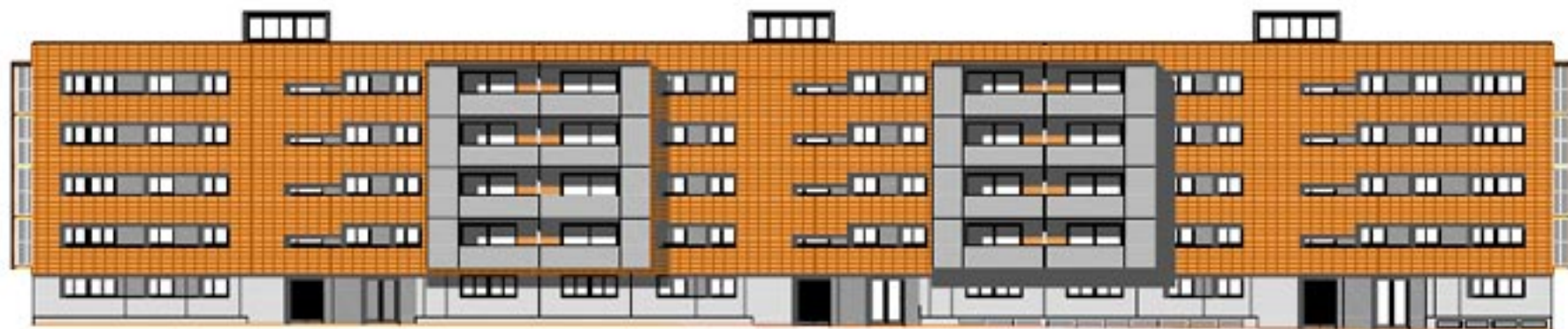
FAÇANA NORD A-A' (1:200)