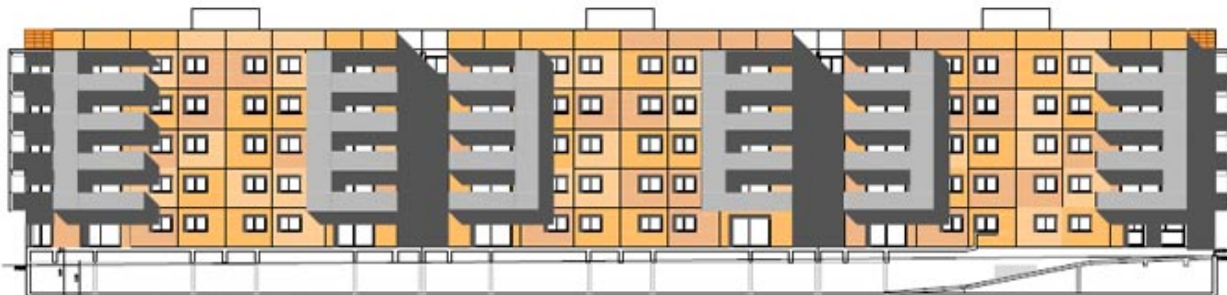
FAÇANA SUD B-B' (1:200)