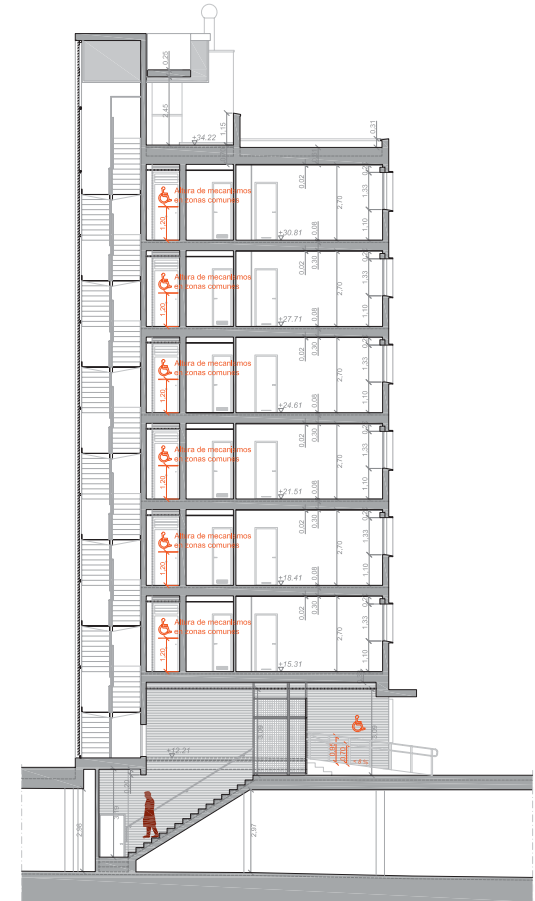
BLOQUE TIPO (BLOQUE 2), SECCIÓN b-b''