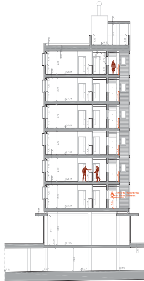
BLOQUE TIPO (BLOQUE 2), SECCIÓN a-a''