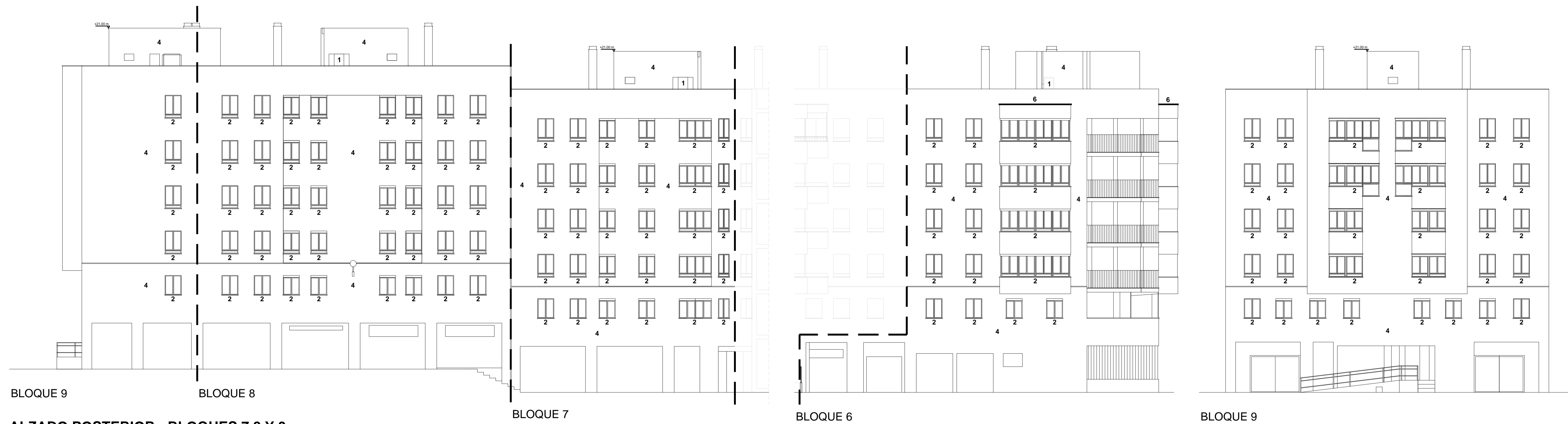
ALZADO POSTERIOR - BLOQUES 7, 8 Y 9