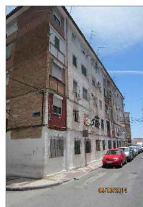
Foto 2. Fachada Oeste