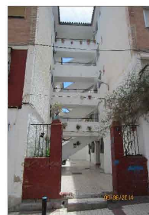
Foto 4. Acceso a edificio