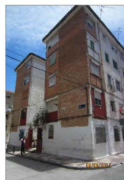
Foto 3. Fachada Principal