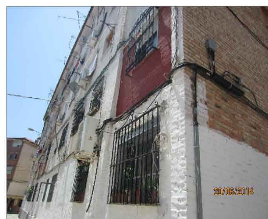
Foto 1. Fachada Este