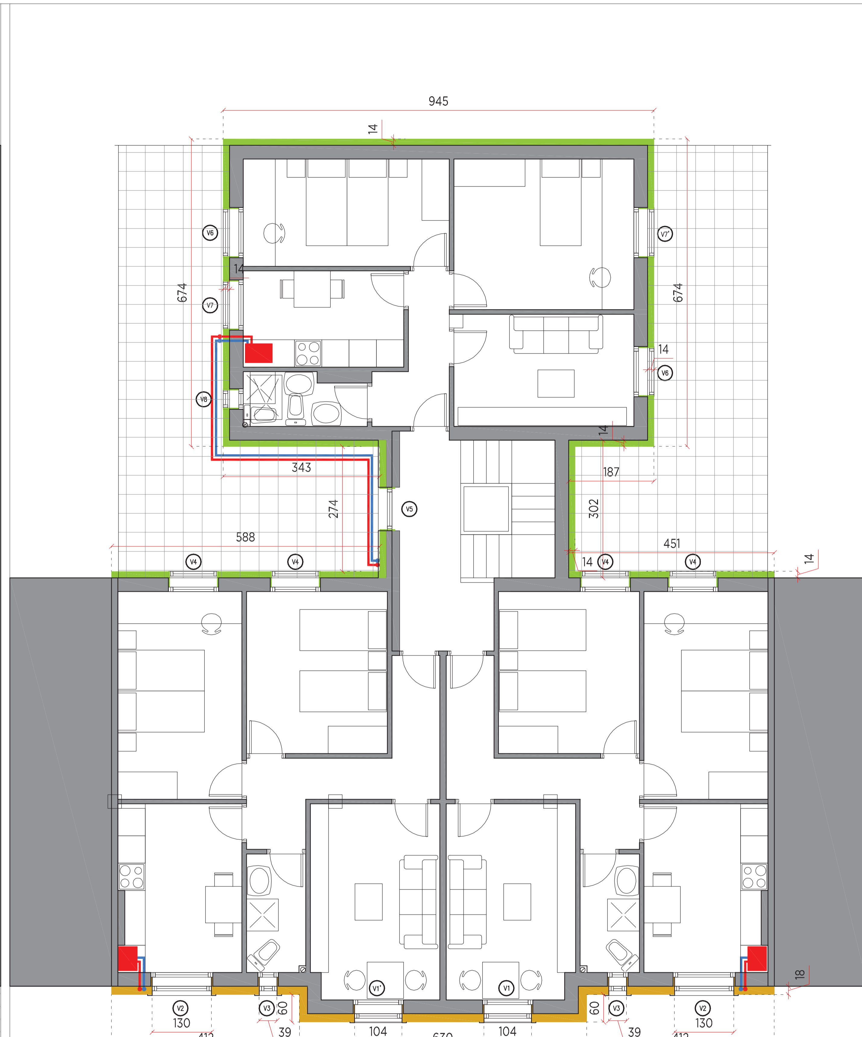
ESTADO REFORMADO. PLANTA BAJA.